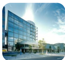
産業振興センター