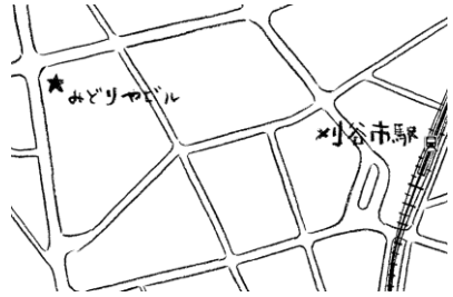
刈谷市駅から徒歩5分に位置する 1992年築4階建のビル。