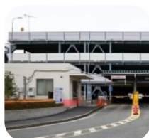
市営駐車場 神田駐車場ほか