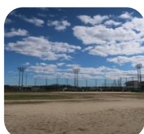
グラウンド 港町グラウンドほか