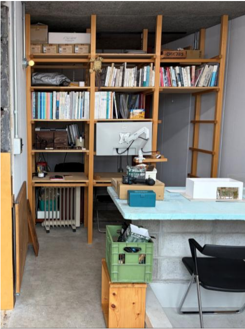
秘密基地のような設計事務所（みどりや設計室）