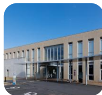
南部生涯学習センター