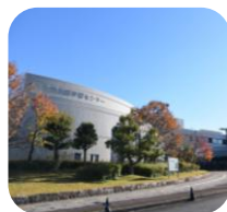
北部生涯学習センター